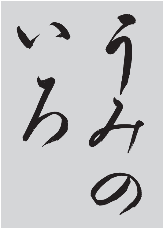
高校かな 高塚竹堂先生書