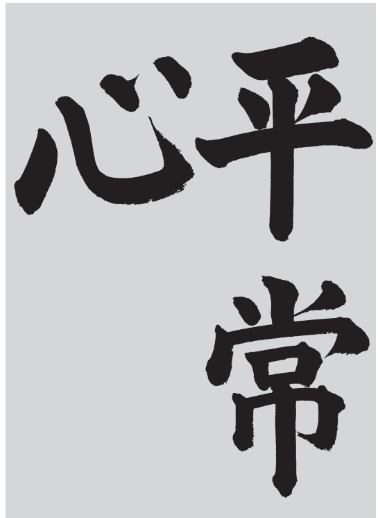
小学六年 高橋紫芳先生書