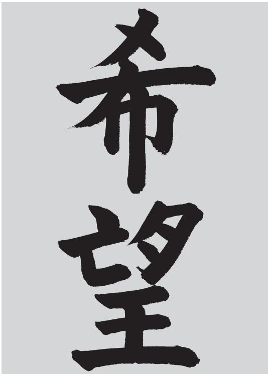
小学五年 高橋紫芳先生書