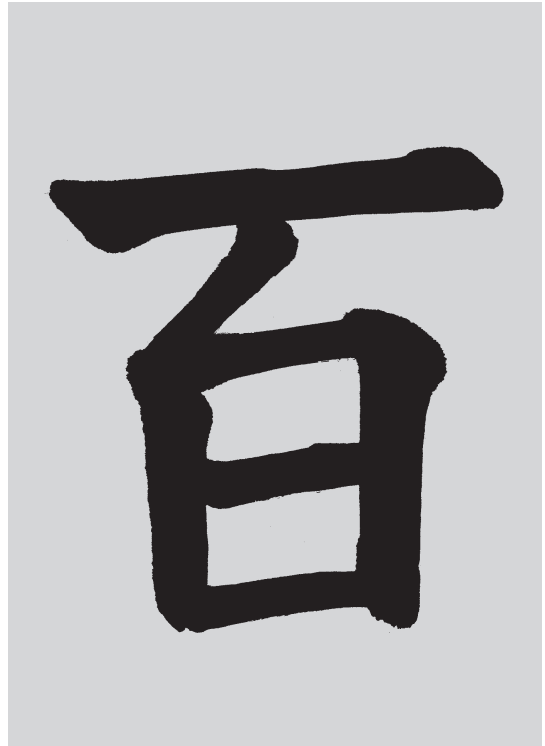
小学二年 高橋香樹会長書